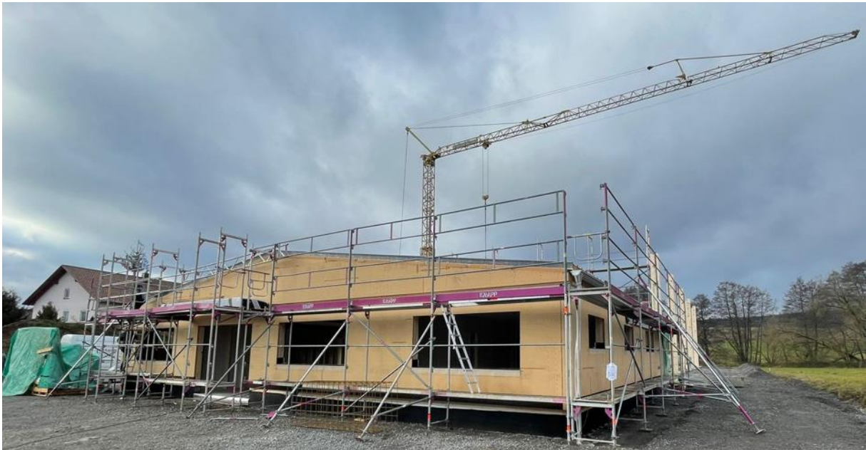
Das neue Gebäude von Rainbow International