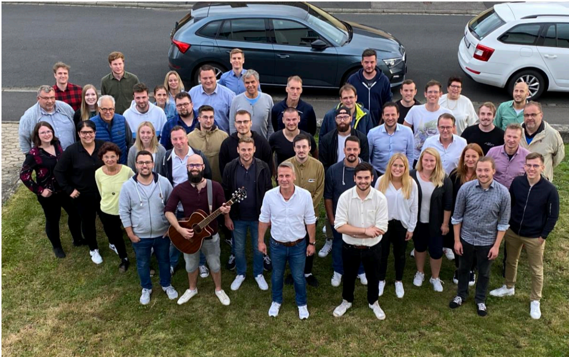
Das Team der ZMI GmbH